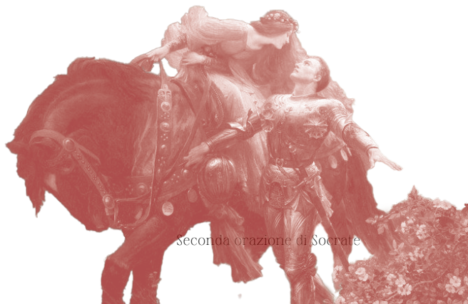
Seconda orazione di Socrate

maggiore 8 . Se, al contrario, si comportano in maniera più rozza, lontana dalla filosofia e avida di onori, può capitare forse che nell'ubriachezza o in qualche altro momento di abbandono i cavalli sfrenati di entrambi, avendo sorpreso le anime indifese e avendole unite per condurle allo stesso scopo, compiano la scelta ritenuta dalla maggior parte della gente la più beata e la portino a compimento. E dopo averla attuata, la rinnovano ormai anche in seguito, ma raramente, in quanto ciò che compiono è stato deciso senza il consenso di tutta l'anima. Anche questi due, dunque, benché meno di quelli, vivono da amici l'uno dell'altro sia durante che dopo l'amore, convinti di essersi scambiati reciprocamente le più grandi promesse e di non poterle sciogliere per diventare un giorno nemici. E al momento della morte, privi di ali, ma desiderosi di metterle, escono dal corpo ottenendo in conseguenza della loro mania d'amore un premio non da poco: infatti, è legge che coloro che hanno già cominciato il cammino sotto la volta celeste non vadano più verso le tenebre e il cammino sotterraneo, ma che siano felici conducendo una vita splendida e procedendo l'uno accanto all'altro, e che, quando sarà il momento, diventino ugualmente alati grazie all'amore.